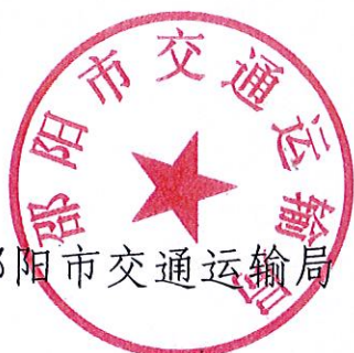
邵阳市交通运输局

市场行为，经市交通运输局、市工业和信息化局、市公安局、市商务局、市市场监督管理局、市互联网信息办公室等六部门同意，现将修订的《邵阳市网络预约出租汽车经营服务管理实施细则（暂行）》印发给你们，请认真遵照执行。